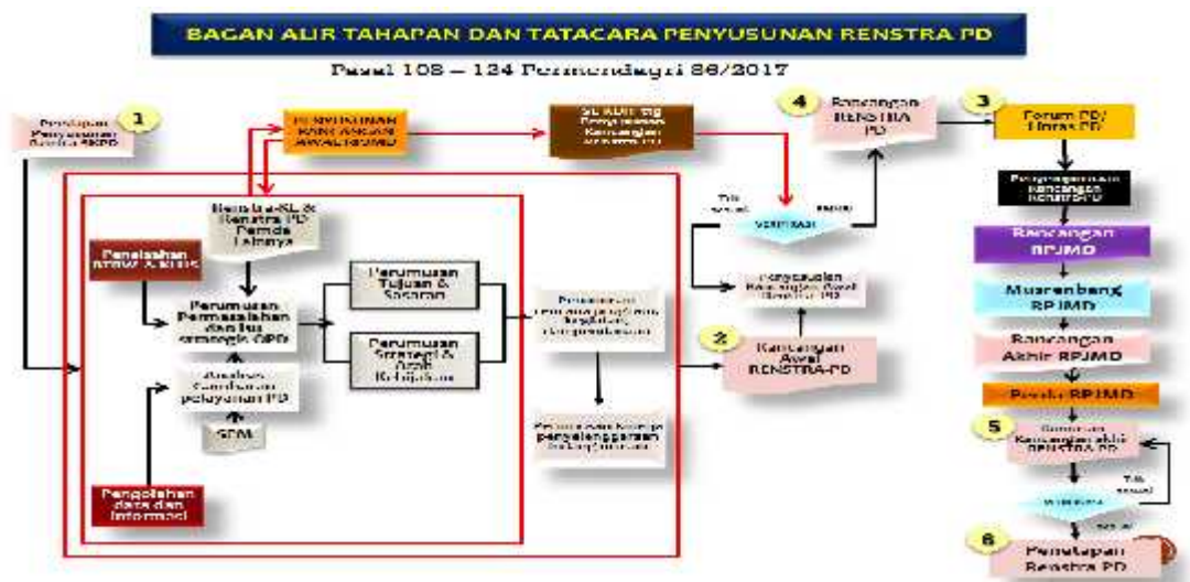
Gambar 1.1 Tahapan Proses Penyusunan Renstra Perangkat Daerah

Proses penyusunan Renstra Perangkat Daerah dilakukan dalam beberapa tahap sebagai berikut: